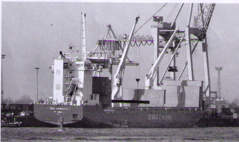
Der Mehrzweckfrachter „BBC Orinoco“ löschte am Mittwoch in Hamburg am Athabaskakai

Freese-Neubau „BBC Orinoco“ kam mit Konstruktionsteilen für Containerbrücken aus China